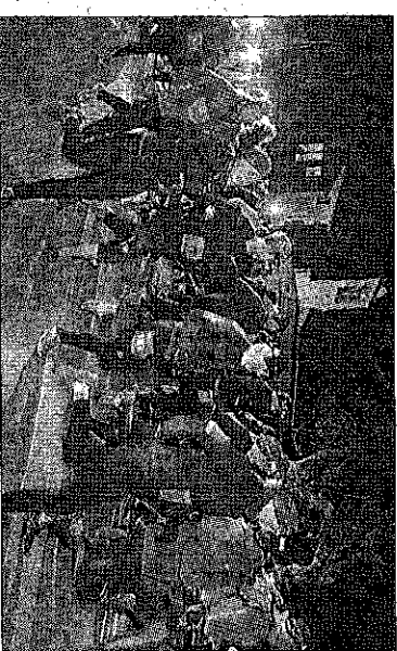
Plus de 140 sportifs au départ de ce trail de nuit.

► Correspondant Mhdi Libre : 06 46 11 78