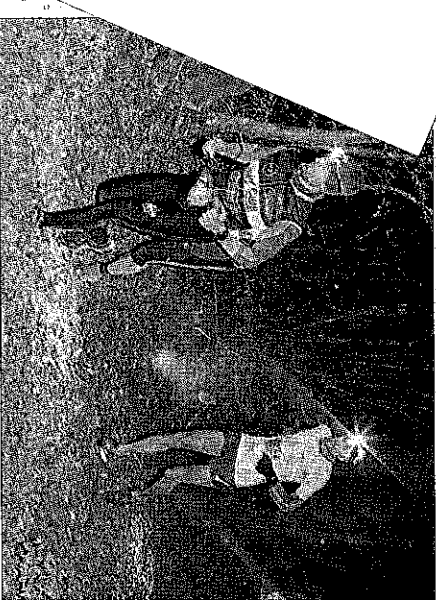
Impossible de courir sans lampes frontales.