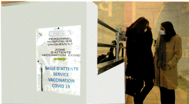
La salle d'attente du service de vaccination Covid-19 de l'Hôpital Lozère.

Une quarantaine de vaccinations pour les personnels de l'établissement sont réalisées chaque jour. Rencontre avec l'équipe et visite des locaux.