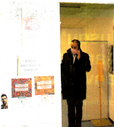
Le centre reçoit de nombreux appels.