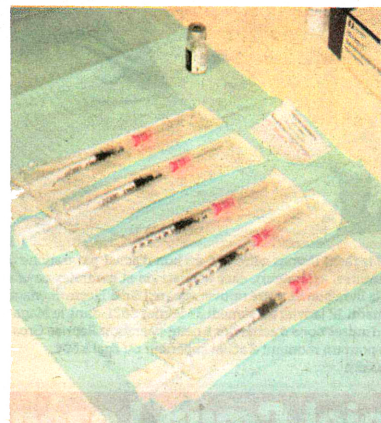
Cinq doses pour un flacon.